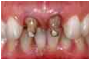
Abb. 2 Präparierte Zähne