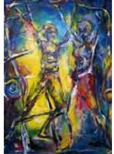
„Begegnung beim Tanz“

Filderstadt-Plattenhardt Tel.: 0711 / 771390