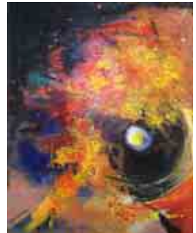
„Das schwarze Loch“

„Im Mittelpunkt meiner Bildaussagen stehen Mensch und Natur“