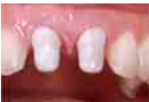
Abb. 3 Procera – “Hütchen”