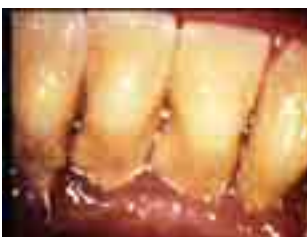
Parodontal geschädigte Zähne

„Das Wort Prophylaxe kommt aus dem Griechischen und bedeutet nichts anderes als Vorbeugung“