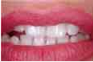
Abb. 1 Zwei Procerakronen