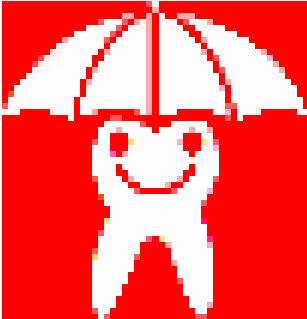
Wir schützen Ihre Zähne!