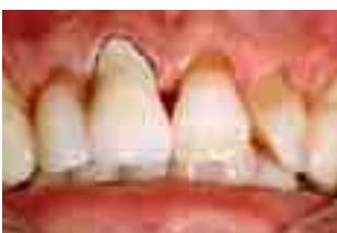
Abb. 4 Metallkeramikkrone mit Metallrand

Hollywoodzähne ? Das könnte man meinen, wenn man sich dieses Bild von herrlich natürlichen Zähnen betrachtet. Dies ist jedoch ein ganz alltäglicher Patientenfall. Denn ohne die Porzellanankronen auf den beiden großen Frontzähnen sieht es wie nebenstehend aus (Abb. 2).